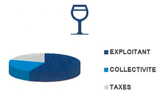
Répartition des montants collectés

Au total, un abonné domestique consommant 120 m 3 payera 321,43€ (sur la base du tarif du 1 er janvier 2021, toutes taxes comprises). Soit en moyenne 2,68€/m 3 , +2,49 % par rapport à 2019 . Sur ce montant, 59.89 % reviennent à l'exploitant pour l'entretien et le fonctionnement, 22.84 % reviennent à la collectivité pour les investissements, 1.42% reviennent au SMERSE, les taxes s'élèvent à 15.85 %.